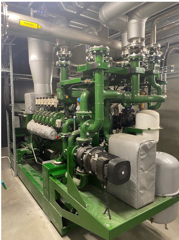
Abbildung 2: Pyrolyseanlage