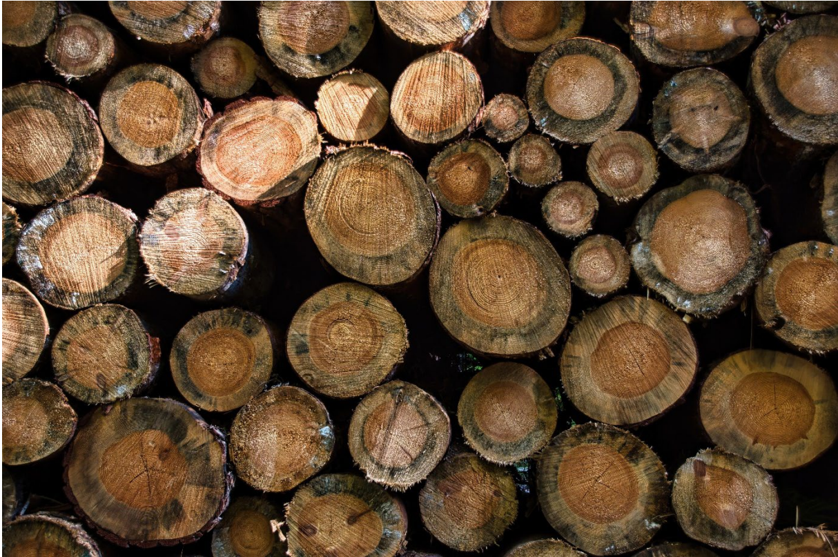
Abbildung 5: Holzpolter mit verblauten Stämmen