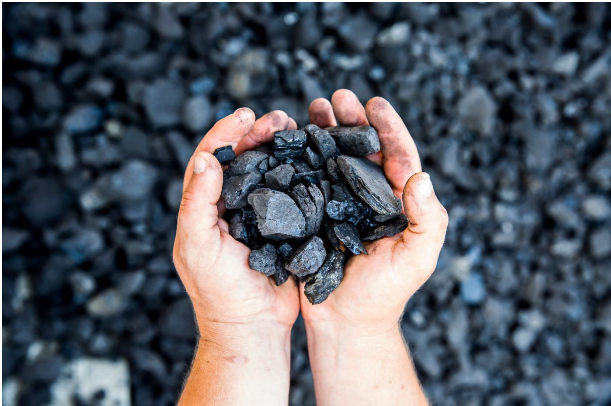
Abbildung 3: Pflanzenkohle