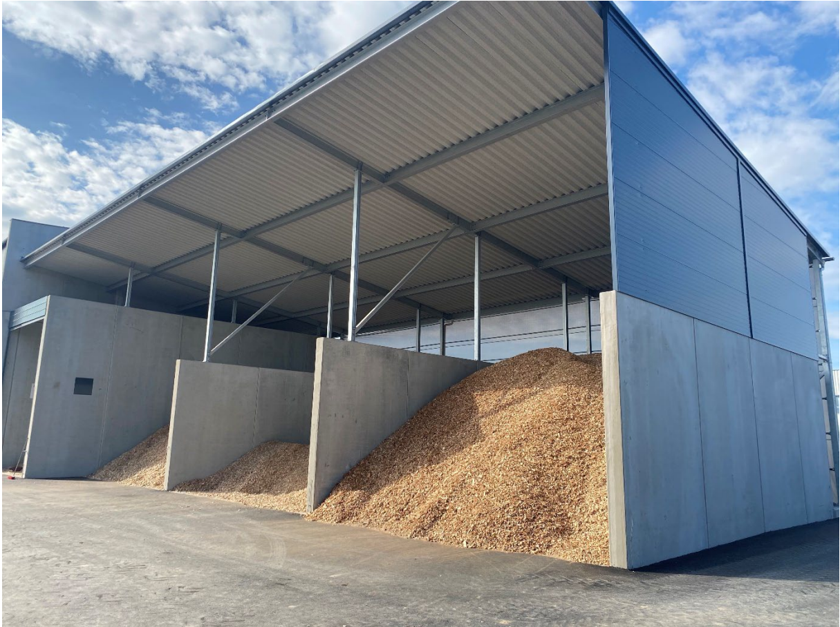
Abbildung 1: Schnitzelbunker